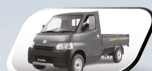
Rock Grey Metallic