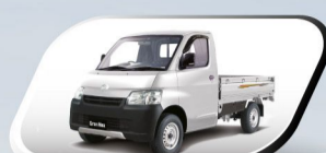
Classic Silver Metallic